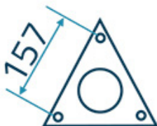
maszt / mast 5-12m