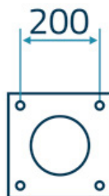
maszt / mast 13-18m