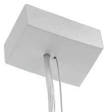
Zawieszanie elektryczne Sztuki w komplecie: 1