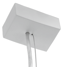
Zawieszenie elektryczne Sztuki w komplecie: 1