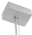
Zawieszanie elektryczne Sztuki w komplecie: 1