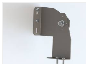
TYTAN LED, ATLAS LED, INDUSTRY LED - uchwyt regulowany (kpl. 2 szt.) (908200)