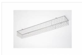
TYTAN LED, ATLAS LED - siatka ochronna 1432mm (907920)