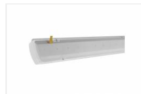
ATLAS LED 1150mm 4500lm 840 - moduł świetlny (952029)