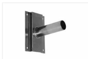
UCHWYT NAŚCIENNY - ocynkowany (314049)