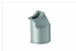
UCHWYT MONTAŻOWY 76MM (UL00141)