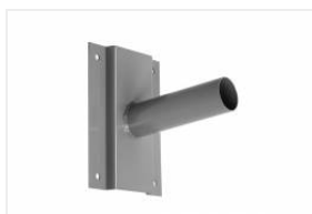
UCHWYT NAŚCIENNY - szary (314056)